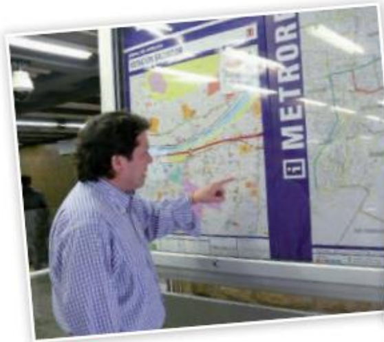
Plano del metro