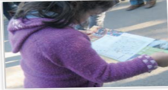
Niña mirando plano del zoológico