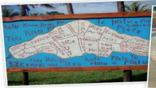
Plano de Isla de Pascua

Trabaja en forma oral , respondiendo las preguntas anteriores.