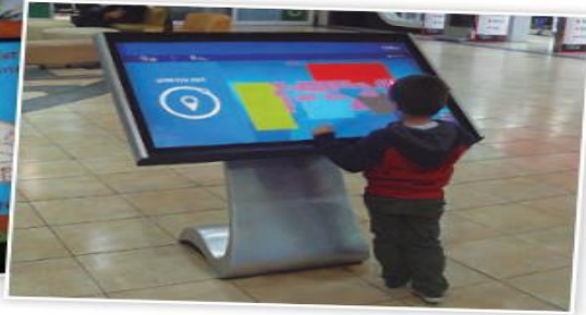
Niño mirando un plano del mall