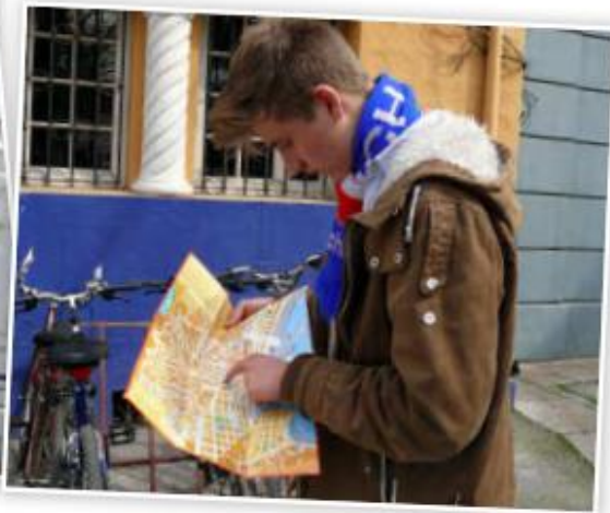
Turista mirando el plano de una ciudad

¿Por qué crees tú que es importante saber interpretar o leer un plano?