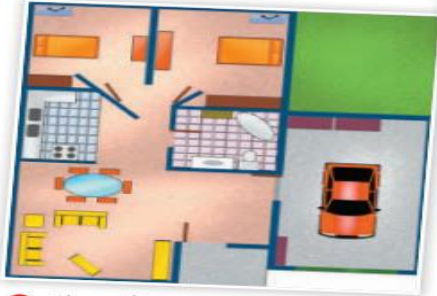
Plano de una casa