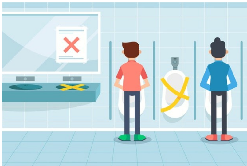
Ejemplo de prácticas para asegurar distanciamiento físico en urinario