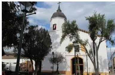
Iglesia de la Merced