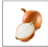
Mitad de cebolla