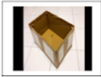
Caja de cartón