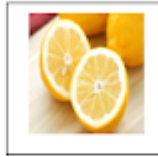
Mitad de limón