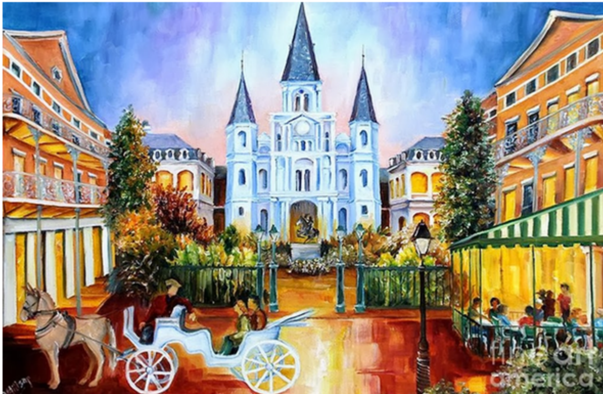
Imagen n° 1.

3. 1. ¿Qué sentimientos y/o sensaciones causan en ti la obra?