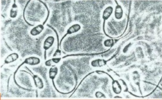
Espermatozoides observados al microscopio óptico.

Los espermatozoides son producidos en los túbulos seminíferos de los testículos mediante un proceso denominado espermatogénesis , que comienza en la pubertad y se prolonga durante toda la vida del hombre.