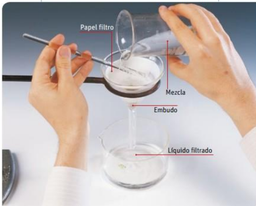
Representación de la filtración en el laboratorio

Imagina que estas en el laboratorio de nuestro Colegio España. En la imagen, la mezcla se dejó pasar a través de un papel filtro, el cual se localizó al interior de un embudo. Bajo este se ubica un recipiente, por ejemplo, un vaso de precipitado o un matraz, que recibirá el líquido filtrado