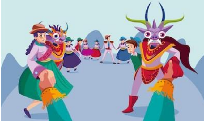
FIESTA DE LA TIRANA