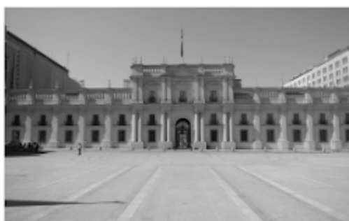
Palacio de la Moneda (1808)