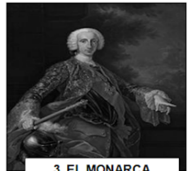
3. EL MONARCA