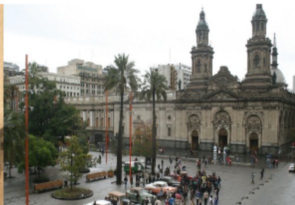
Plaza de Armas. Siglo XXI