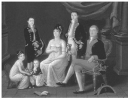
1. LOS CRIOLLOS