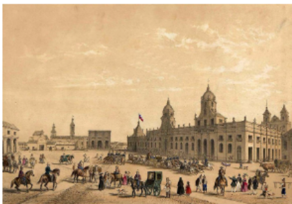
Plaza de Armas Periodo colonial inicio siglo XIX