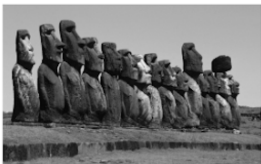
Moais, Isla de Pascua