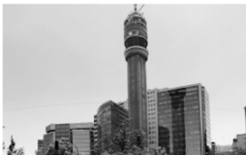
Torre Entel (1974)