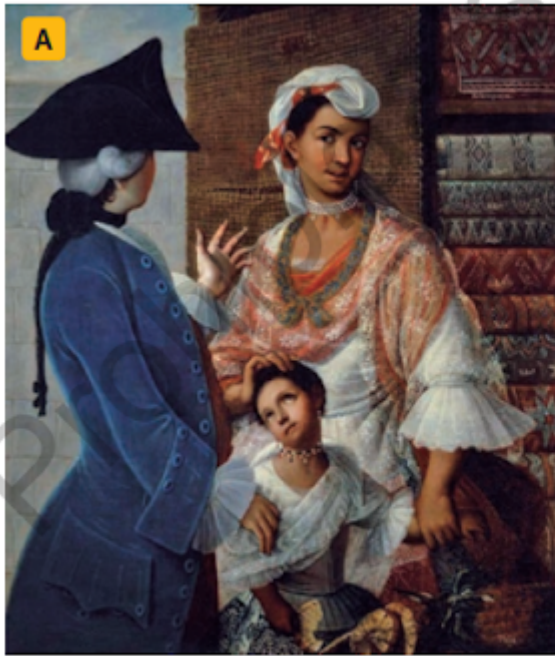
↑ Cabrera, Miguel (ca. siglo XVIII). De Español e India, Mestiza . Pintura de castas.

Observa la imagen A y B, luego responde la pregunta 1: