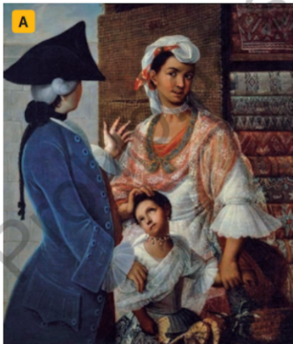
↑ Cabrera, Miguel (ca. siglo XVIII). De Español e India, Mestiza . Pintura de castas.

Observa la imagen A y B, luego responde la pregunta 1: