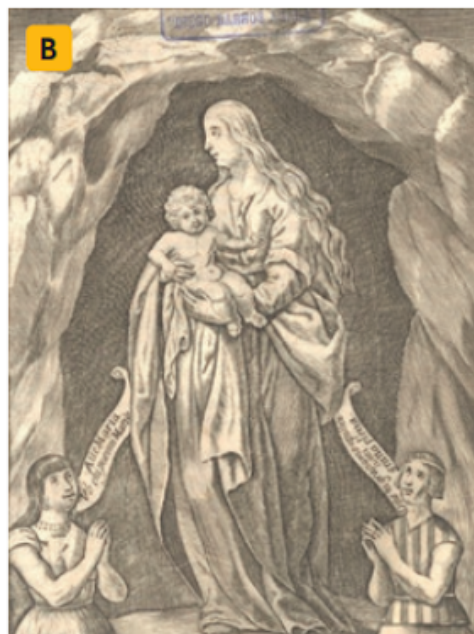
↑ Mapuche orando a la Virgen María. En Alonso de Ovalle (1646). Histórica relación del Reino de Chile y de las misiones y ministerios que exercía en él la Compañía de Jesús . Roma.

3. 1. Según lo observado en las imágenes podemos concluir que el sincretismo hace referencia a: * 1 punto