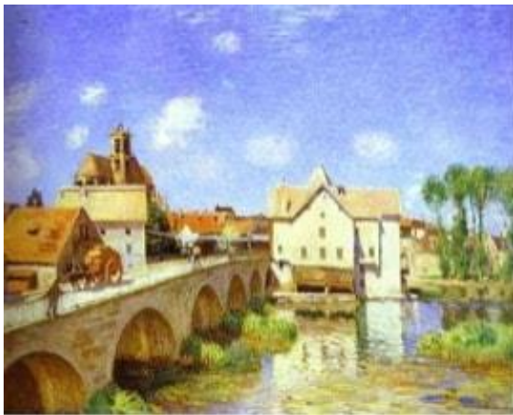
Imagen N° 1