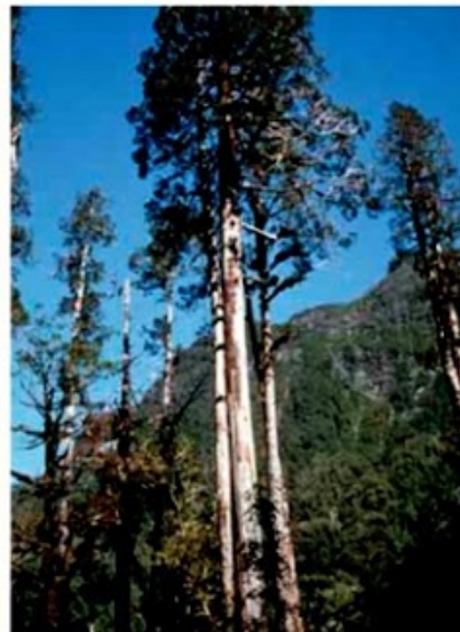
Parque Nacional Los Alerces, Argentina. Creado para proteger los bosques de alerce.

Si un bosque de alerce, que ha tardado cientos de años para estar en condiciones de ser explotado, es talado, no volverá a regenerarse. Constituye un recurso no renovable, de la misma manera que lo es una mina de oro. Por eso hoy en Chile está estrictamente prohibido cortar alerces.