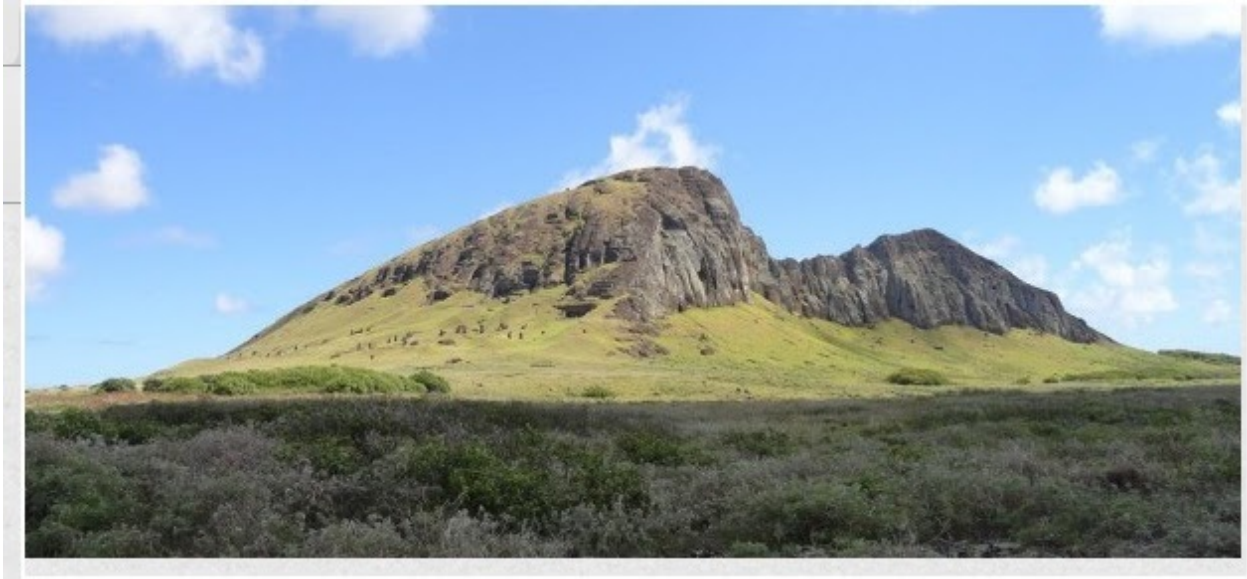
Imagen de Isla de Pascua:

Observa la siguiente infografía y responde las preguntas 2,3 y 4: