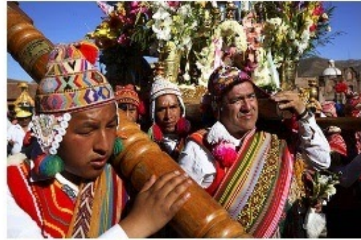
Indígenas mayas y quechuas (Guatemala y Perú)

CONTENIDO: Hoy aprenderás a identificar actores de la organización política de Chile, cómo son elegidos y sus funciones.