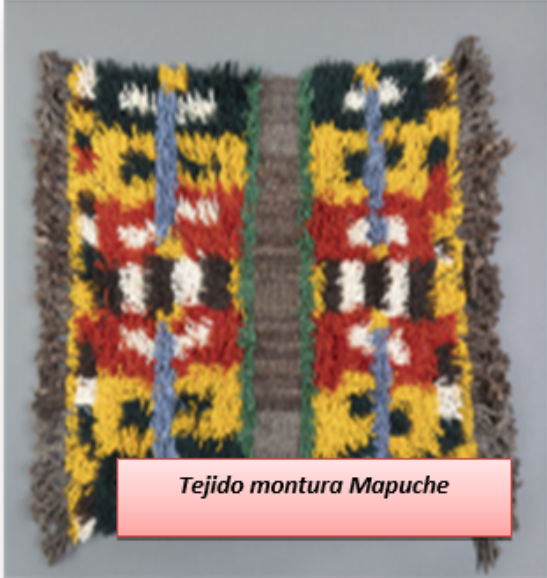
Tejido montura Mapuche