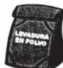
Un sobre de levadura en polvo