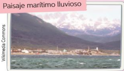
Paisaje marítimo lluvioso

Algunos lugares: Europa alrededor del mar Mediterráneo, Zona Central de Chile.