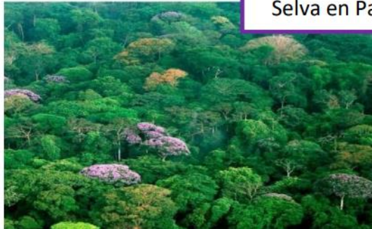
Selva en Panamá