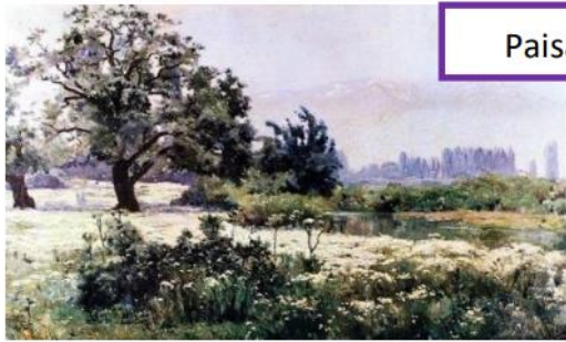
Paisaje con manzanillas

1.- Vamos a observar obras de arte de la naturaleza.