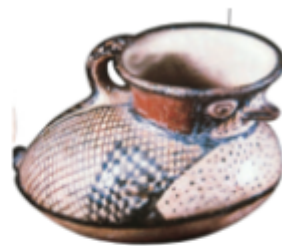
Alfarería Diagueta (Jarro Pato).