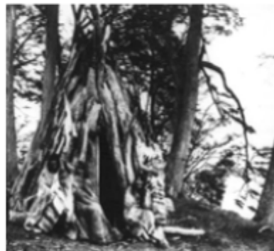
Vivienda de Changos