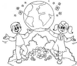
Me gusta cuidar el planeta.