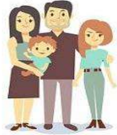
Familias de acogida