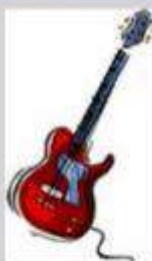
la guitarra eléctrica