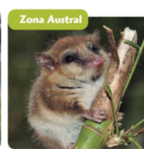
▲ Monito del monte.