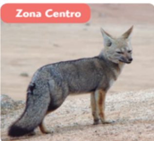
▲ Zorro Chilla.