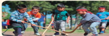
▲ El palín es un juego que se sigue practicando tanto en ciudades como en el campo.