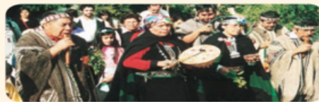
▲ Ceremonias como el nguillatun se siguen realizando en la actualidad.