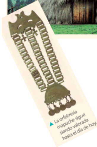
▲ La orfebrería mapuche sigue siendo valorada hasta el día de hoy.