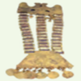
+ Adornos y joyas