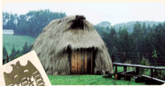
◀ Ruca mapuche