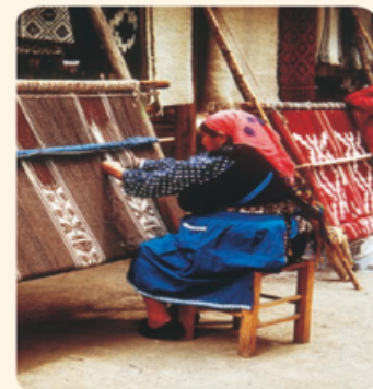
▲ Mujer mapuche trabajando en un telar.