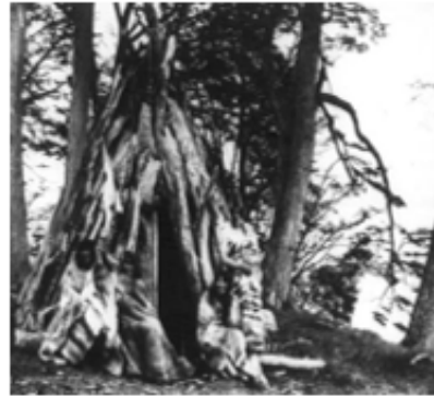
Vivienda de Changos