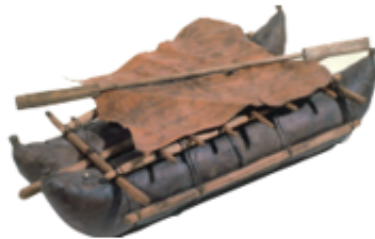
Embarcación de Changos