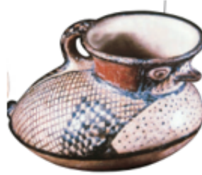
Alfarería Diaguita (Jarro Pato).