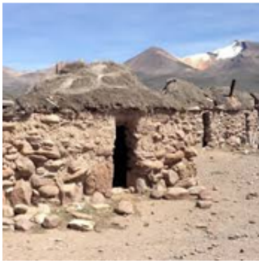
Uta, vivienda Aymara.