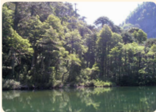
▲ Bosque nativo.