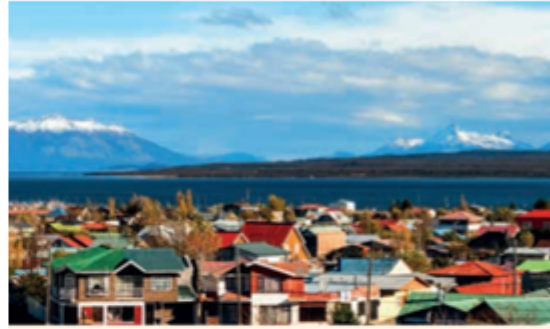
Puerto Natales, región de Aysén del General Carlos Ibáñez del Campo.

Las principales actividades económicas son la ganadería, la actividad forestal y el turismo