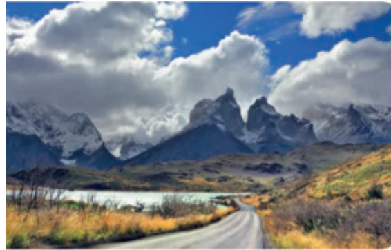
Camino a los Cuernos del Paine, región de Magallanes y Antártica Chilena.

Lee atentamente y luego responde haciendo un clic o usando tu teclado.