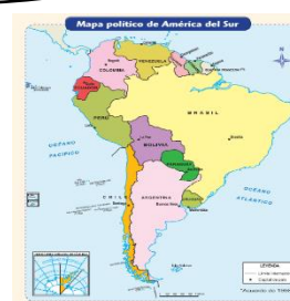
América del Sur

* Continentes: América, Asia, Antártida, Oceanía, Europa y África.