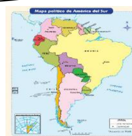
América del Sur

* Continentes: América, Asia, Antártida, Oceanía, Europa y África.