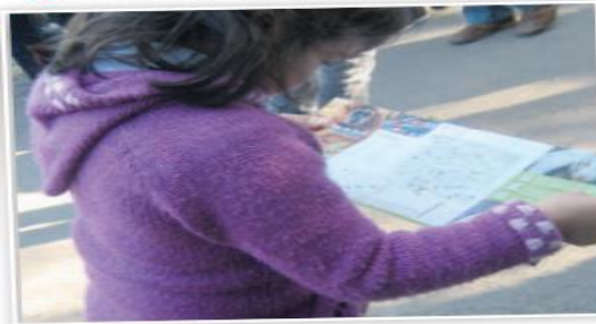
↻ Niña mirando plano del zoológico