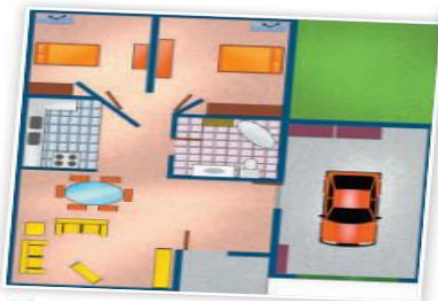
↻ Plano de una casa