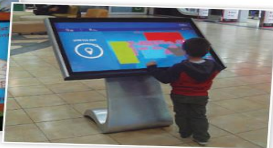
↻ Niño mirando un plano del mall