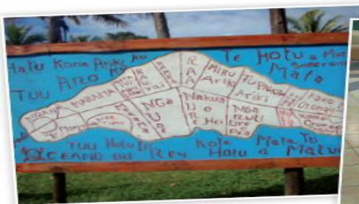
↻ Plano de Isla de Pascua

Trabaja en forma oral , respondiendo las preguntas anteriores.