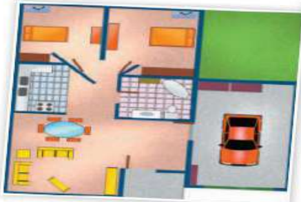
Plano de una casa