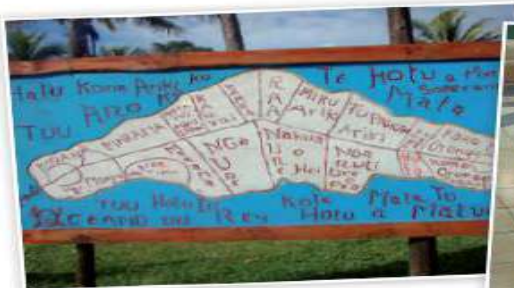
Plano de Isla de Pascua

Trabaja en forma oral , respondiendo las preguntas anteriores.