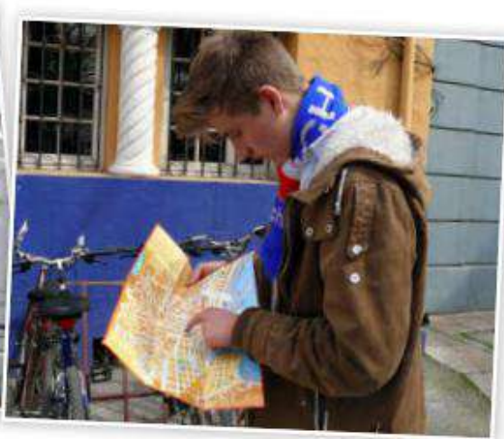
Turista mirando el plano de una ciudad

¿Por qué crees tú que es importante saber interpretar o leer un plano?