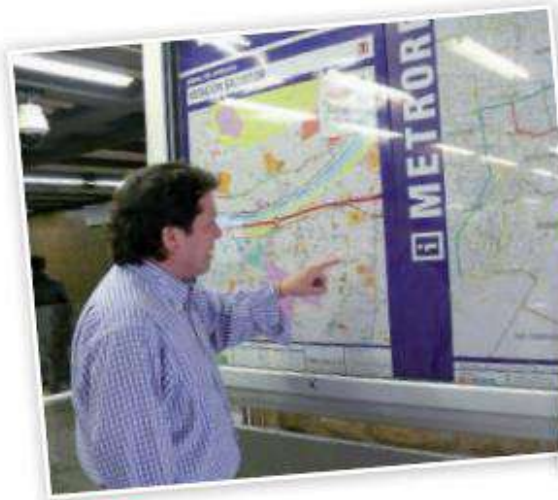
Plano del metro