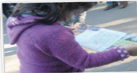
Niña mirando plano del zoológico