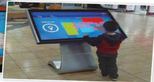
Niño mirando un plano del mall