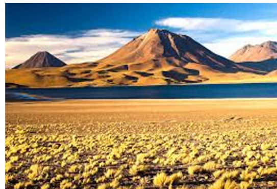
Imágenes del Desierto de Atacama

Fijate bien en los colores que resaltan en el desierto.